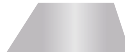
强反光物体或者金属件

Q5X传感器既可以检测金属件是否存在，也可以通过检测金属件的边缘来验证金属件是否摆放正确。此外，Q5X即使在锐角也能可靠地检测强反光物体。其背景抑制性能，使得传感器可以忽略位于关断点以外的任何东西。Q5X的检测范围可达2米，可以检测相距较远的恶劣环境中的被测物，降低传感器损坏的风险，从而节省更换和维护成本。